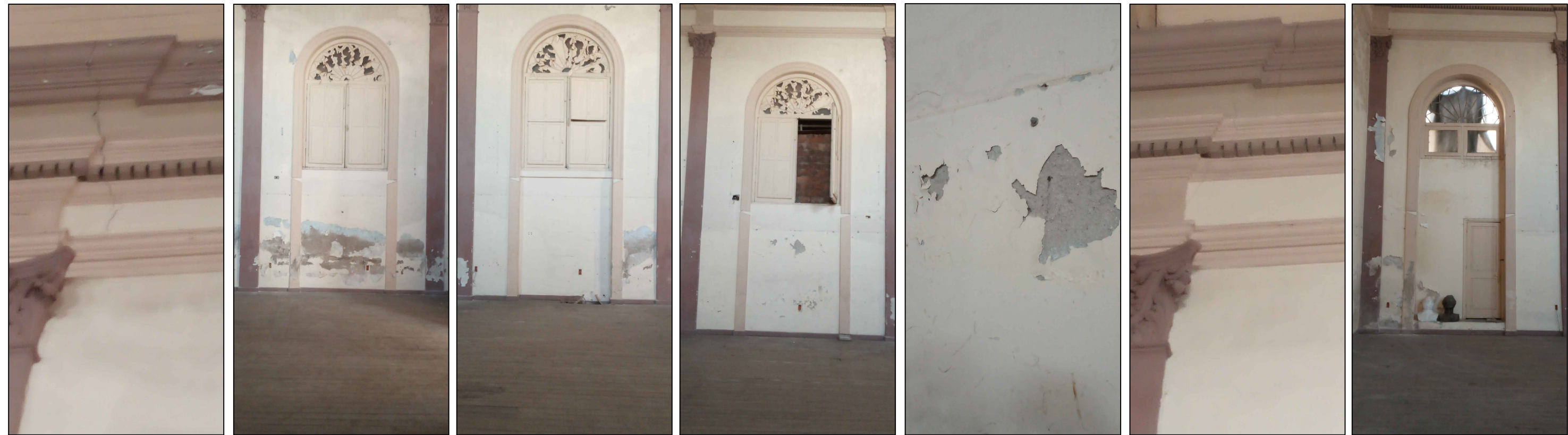
SECTOR 3.4 SECTOR 1.13 SECTOR 1.14 SECTOR 1.15 SECTOR 1.16 SECTOR 3.4 SECTOR 3.5