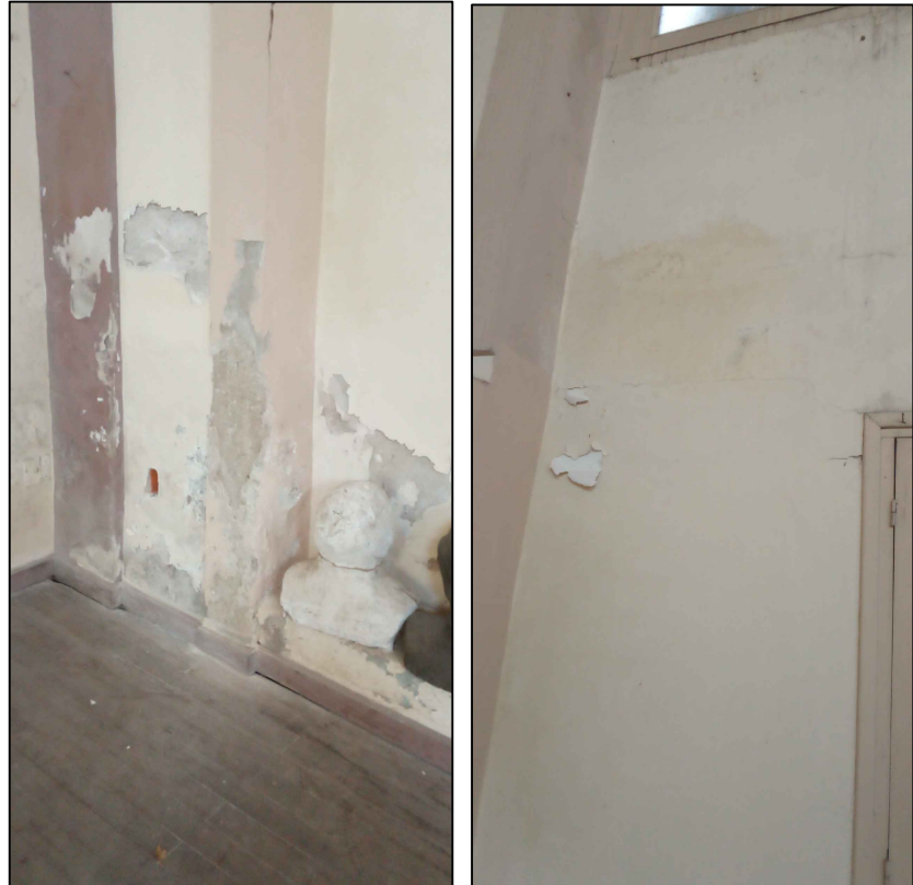
SECTOR 1.17 SECTOR 2.1