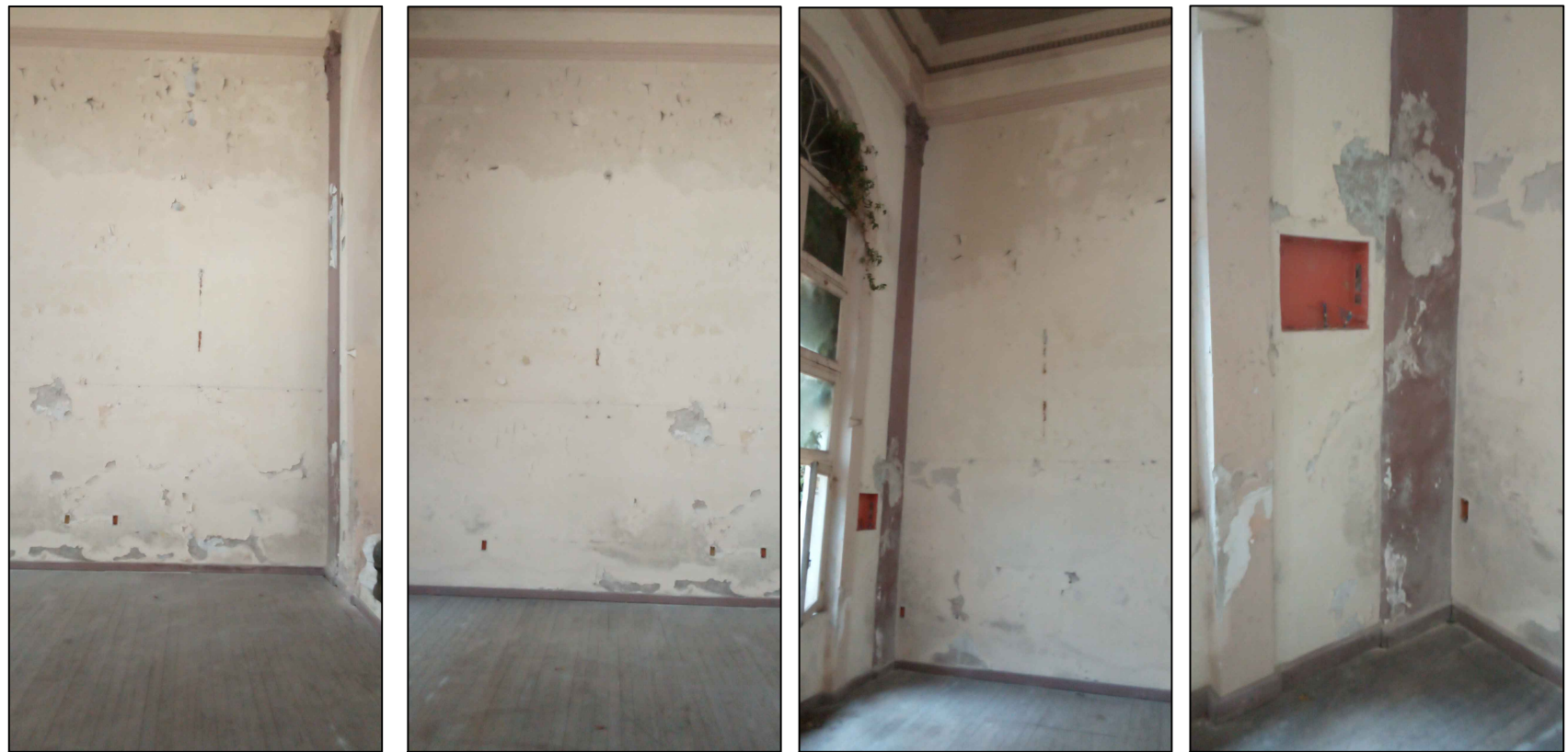
SECTOR 1.18 SECTOR 1.19 SECTOR 1.20 SECTOR 1.21